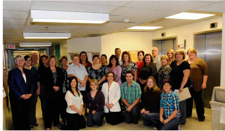
Équipe de la BYTNB de Saint John

L'inspection globale, qui a eu lieu les 19 et 20 septembre, a été réalisée par un chirurgien de la cornée et un employé de la Banque d'yeux, tous les deux membres du comité d'agrément de l'EBAA. Un examen de la conformité aux normes de pratique du programme ainsi que de tous les aspects des fonctions de la banque oculaire ont fait partie intégrante de l'évaluation. Des entrevues individuelles ont été menées auprès du directeur médical, du directeur, du gestionnaire de la Qualité et des techniciens de la BYTNB en vue d'évaluer leurs connaissances des normes médicales et de leur rôle au sein du programme. De plus, des employés accrédités et non accrédités ont fait un prélèvement de cornée dans le cadre de l'évaluation des techniques aseptiques et chirurgicales. Pour terminer l'évaluation, les inspecteurs se sont penchés sur les dossiers des donneurs, l'entretien des équipements, l'entreposage des dossiers sur les milieux de préservation, les dossiers d'entraînement ainsi que les mesures de contrôle de la qualité et d'assurance de la qualité.