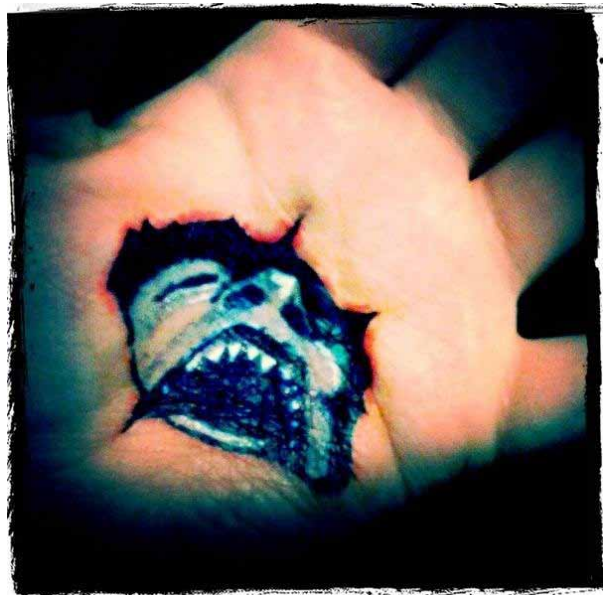
Tableau intitulé « He is Here to Stay »

Commandité par le ministère de la Santé, le prix « Étoile communautaire » peut être attribué à un individu, à un groupe, à une entreprise, à une organisation ou à une collectivité qui favorise la prévention des dépendances, les interventions ou les activités de post prévention. Chaque année, les réseaux de santé Horizon et Vitalité ont le privilège de sélectionner et d'honorer les lauréats de ce prix issus de la collectivité.