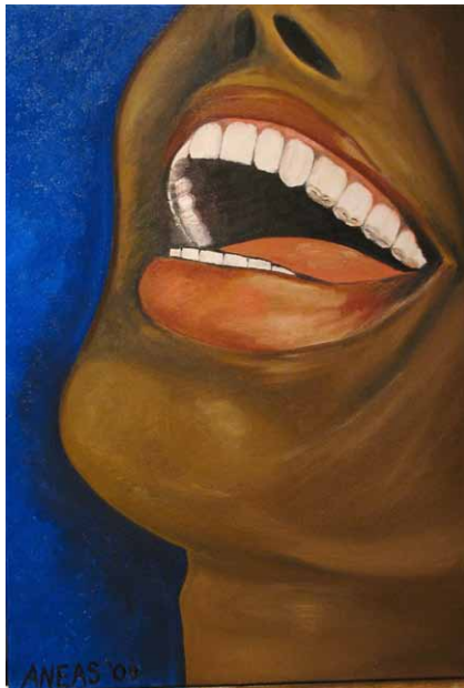
Tableau intitulé « Ho'Oponopono »

L'ouverture de l'exposition sera marquée par la tenue d'un gala le 18 novembre, à l'occasion duquel le prix « Étoile communautaire 2013 » sera attribué. Cliquez ici pour de plus amples renseignements et pour connaître les heures d'ouverture de l'exposition d'art.